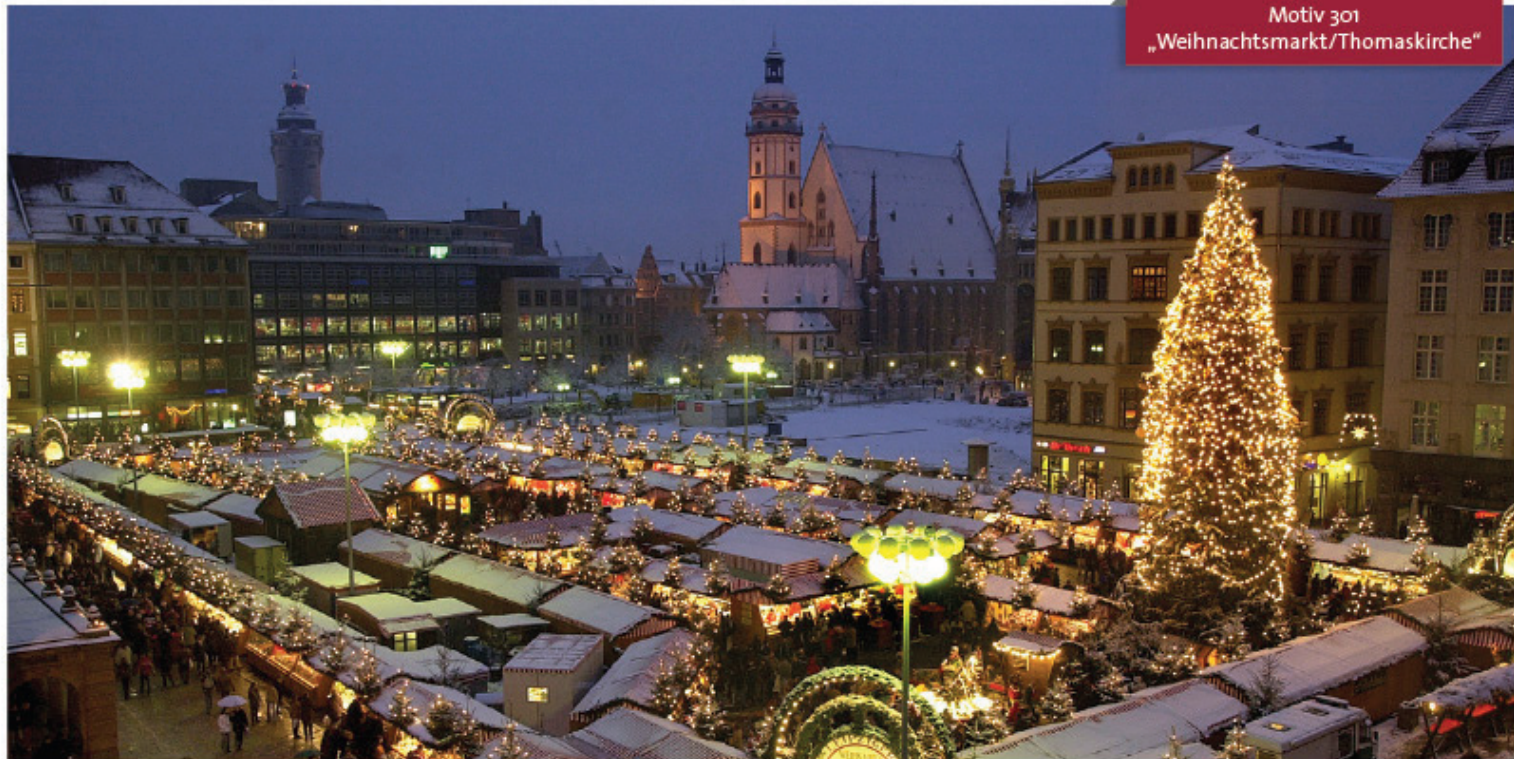
Motiv 301 „Weihnachtsmarkt/Thomaskirche“