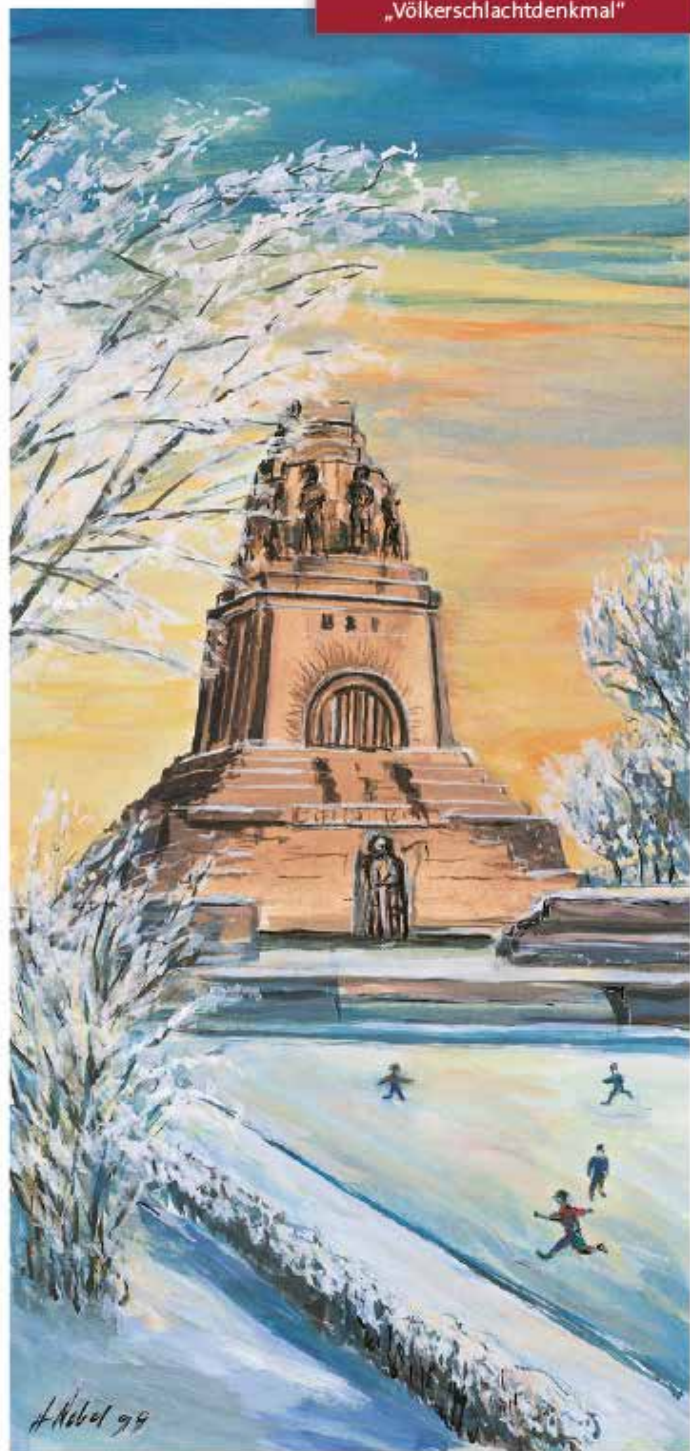
Motiv 9902 „Völkerschlachtdenkmal“