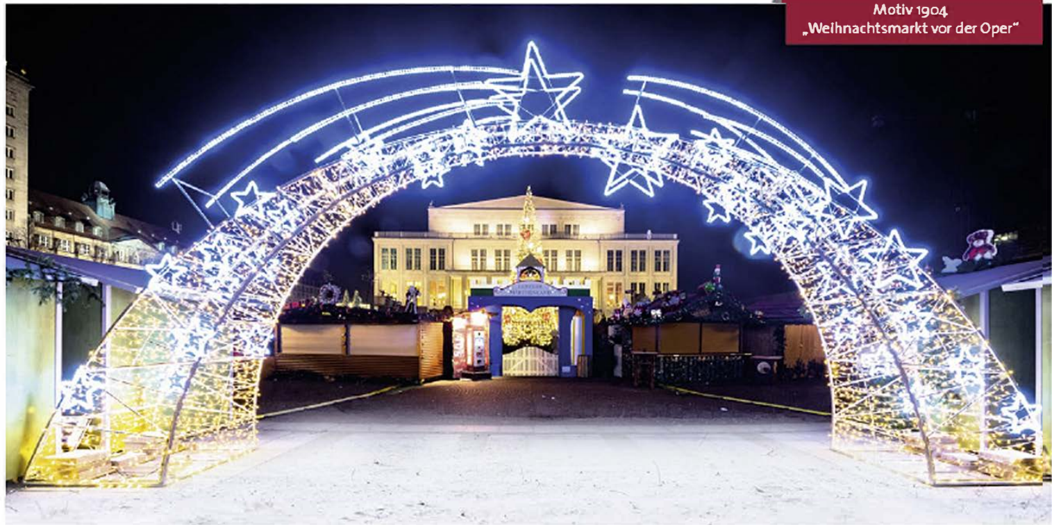
Motiv 1904 „Weihnachtsmarkt vor der Oper“